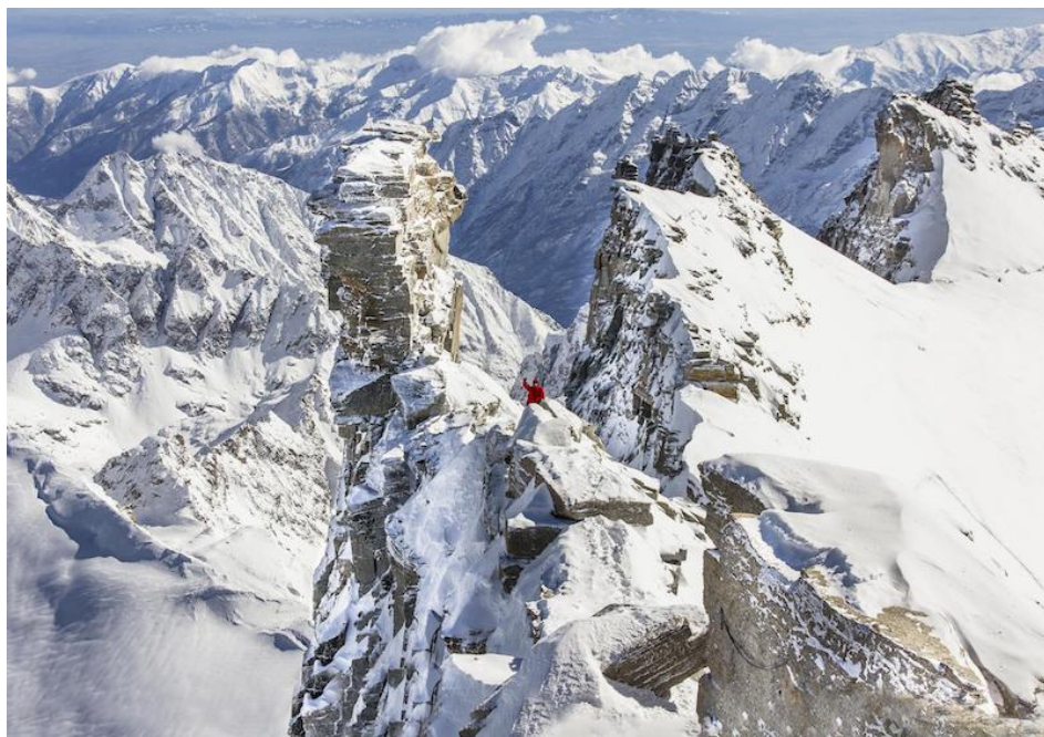
Confini, Cima Gran Paradiso

Le competenze così acquisite saranno poi messe alla prova sul campo durante le ascensioni delle settimane successive.